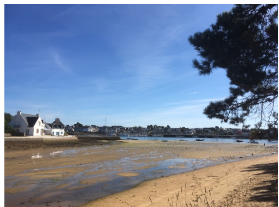
De sémaphore en tweemaal zicht op Etel