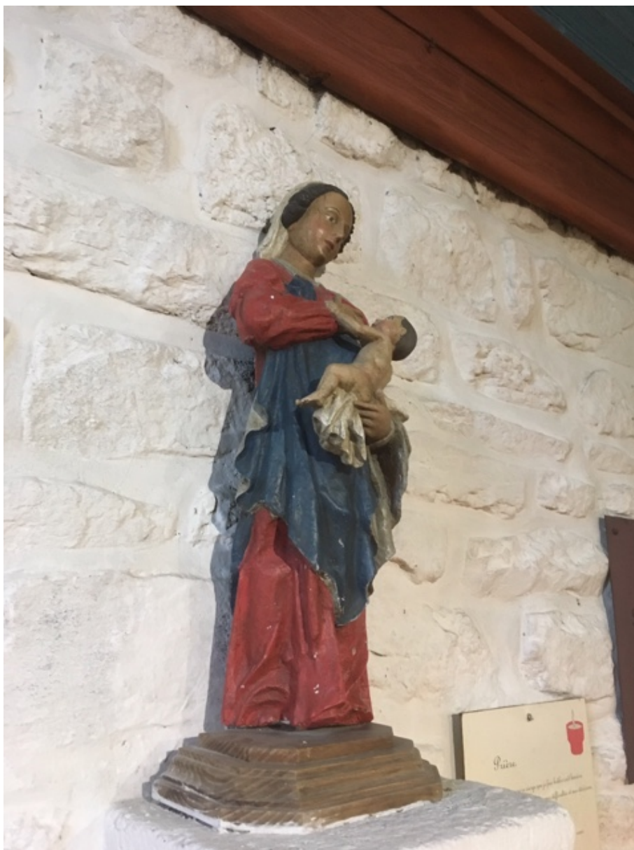
Een volgens mij uniek beeldje dat ik heb gevonden in het kerkje van Sainte Marine: Maria die Jezus, inclusief blote billen, de borst geeft.