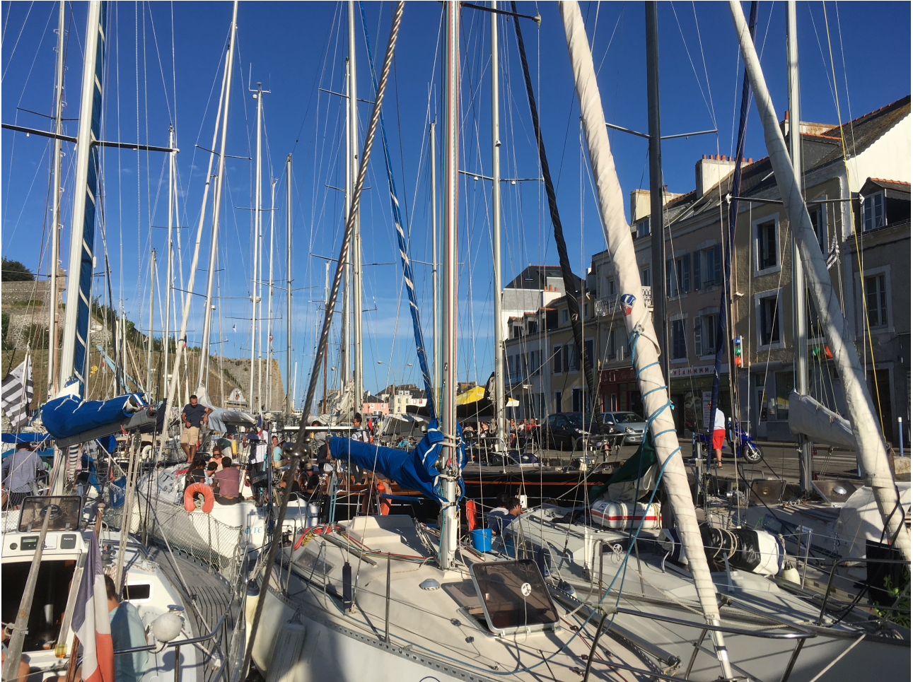
le Palais in een vakantie weekend