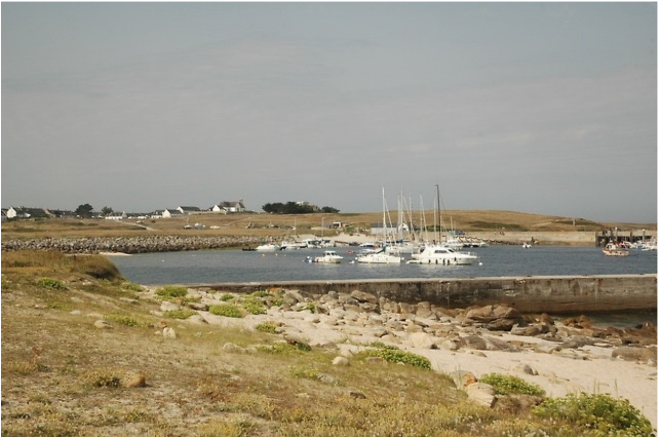
Ankeren bij Hoëdic