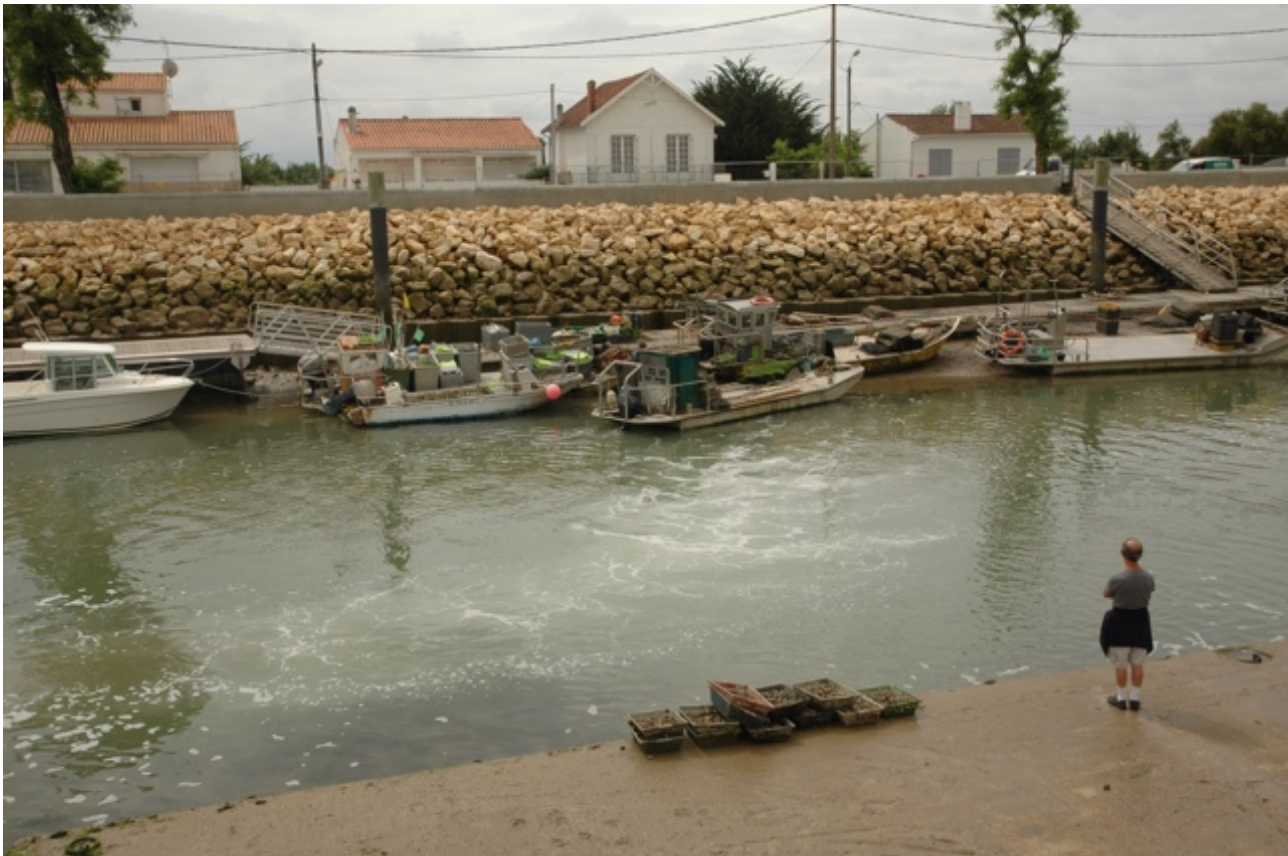
Mosselboten bij Boyardville