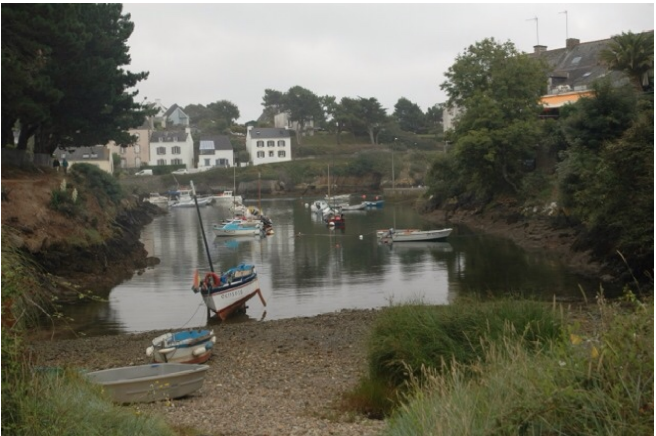
Doëlan bij halftij

Doëlan, een dikke tien mijl noordelijker langs de kust is een deels droogvallend haventje in een door hoge rotsen omringde smalle riviermond. Er zijn geen steigers maar alleen een aantal meerboeien waaraan je je boot voor en achter vast kunt maken. Dat is wel nodig ook, want voor een draaiing op het tij zou het te smal zijn. De omgeving is schitterend: hoge rotsen omzomen het water en langs de zee loopt het kustpad dat je kunt lopen. Daarnaast zijn er nog verschillende uitgezette wandelingen. Een prima plek dus om een dag over te blijven ondanks het gebrek aan winkels, maar daar waren we door onze pilot voor gewaarschuwd. Maar brood hebben ze bij het café. En dan heeft het ook nog sanitair en hoort het bij de club. Een pareltje dus.