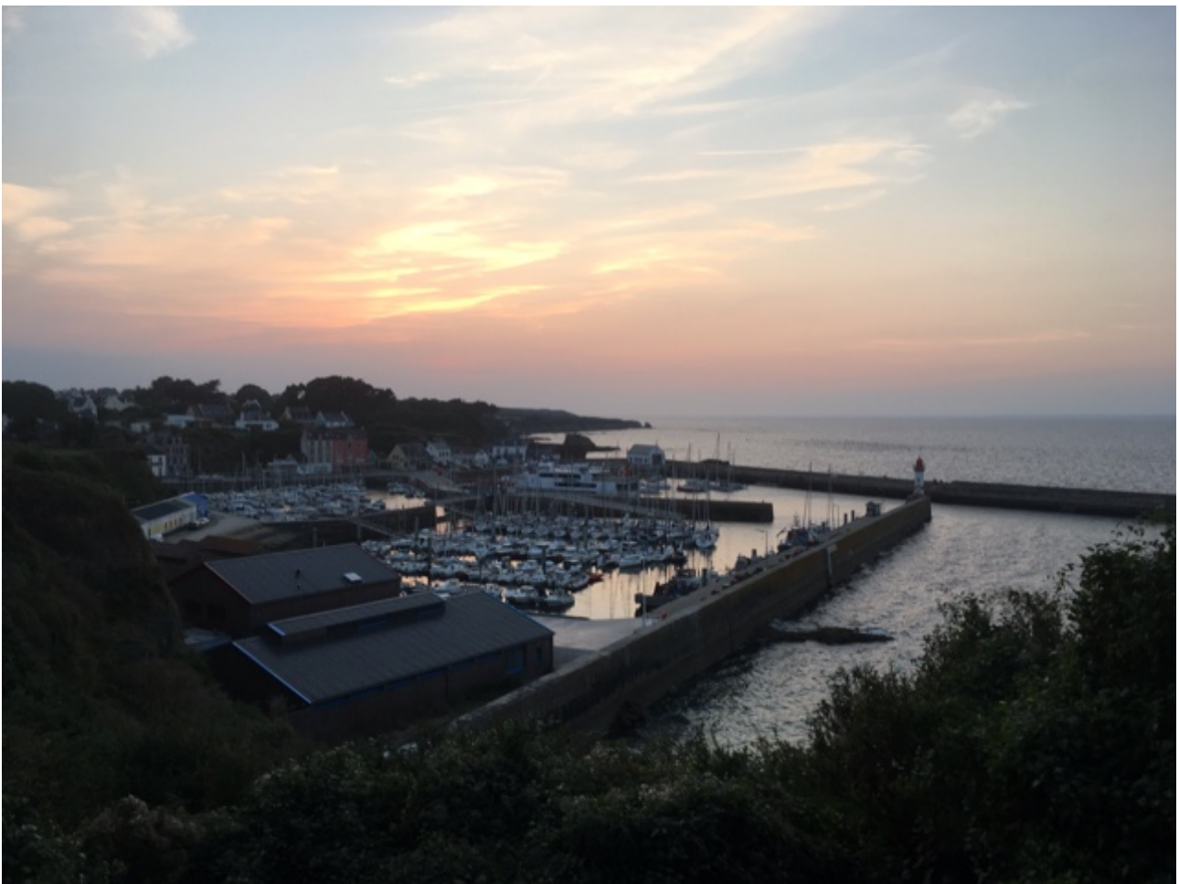
Port Tudy bij avond

De haven van Port Tudy is klein. In de buitenhaven, waar ook de veerboot naar Lorient aanlegt, liggen ankerboeien en in de binnenhaven is een beperkt aantal visiteursplaatsen. We hadden het geluk dat er daar eentje nog van vrij was. Met het bijbootje er achter en met veel duwen en trekken zijn we er gaan liggen. Eerst Ollie uitlaten. Ik heb hem zelden zoveel zien plassen. Toen het motortje op het hek en het bootje op de punt. Eindelijk rust, even plat en een paar uur slapen. We waren er aan toe na een bijna doorwaakte nacht.