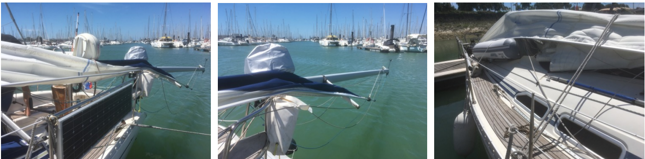
Zo zijn we naar de haven gevaren