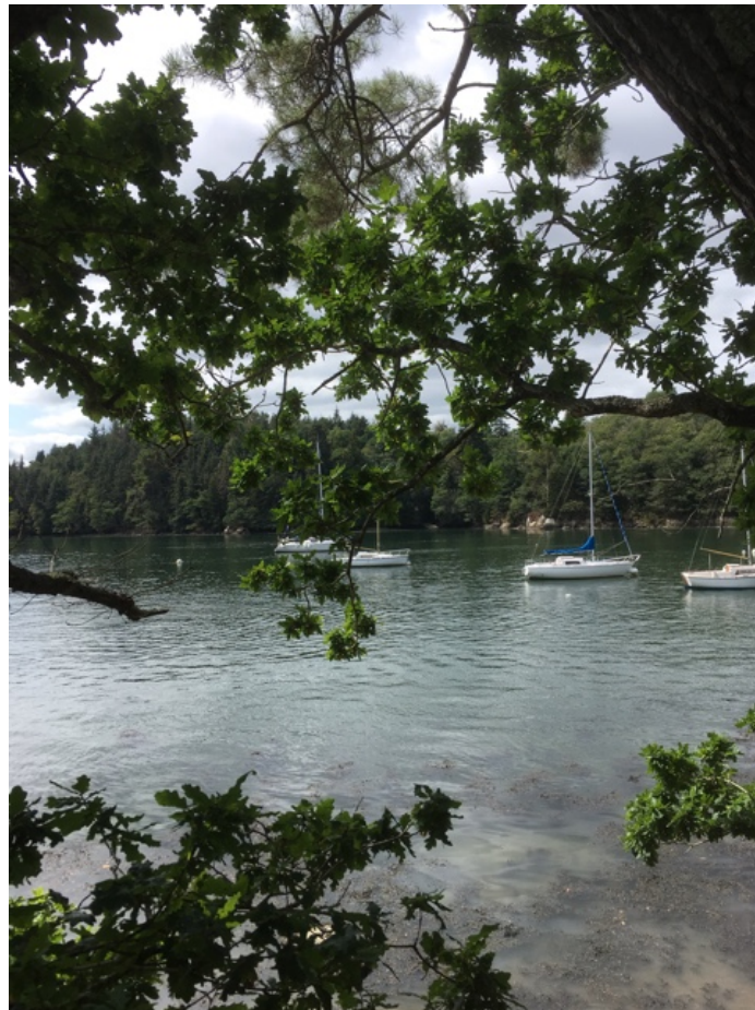
Op de Odet aan een ankerbal. De andere boten liggen er permanent en zijn onbewoond.

Ik ben blij met de zonnepanelen en het nieuwe buitenboordmotortje.