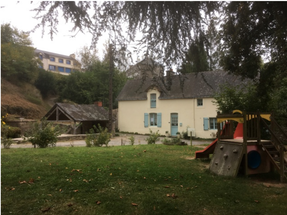
Dit huis dus, zelfs bij somber weer ligt het prachtig

We hebben alleen het probleem dat we een trein hebben geboekt voor volgende week vrijdag. Het is misschien wat egoïstisch, maar daarna mag het van mij gaan regenen.