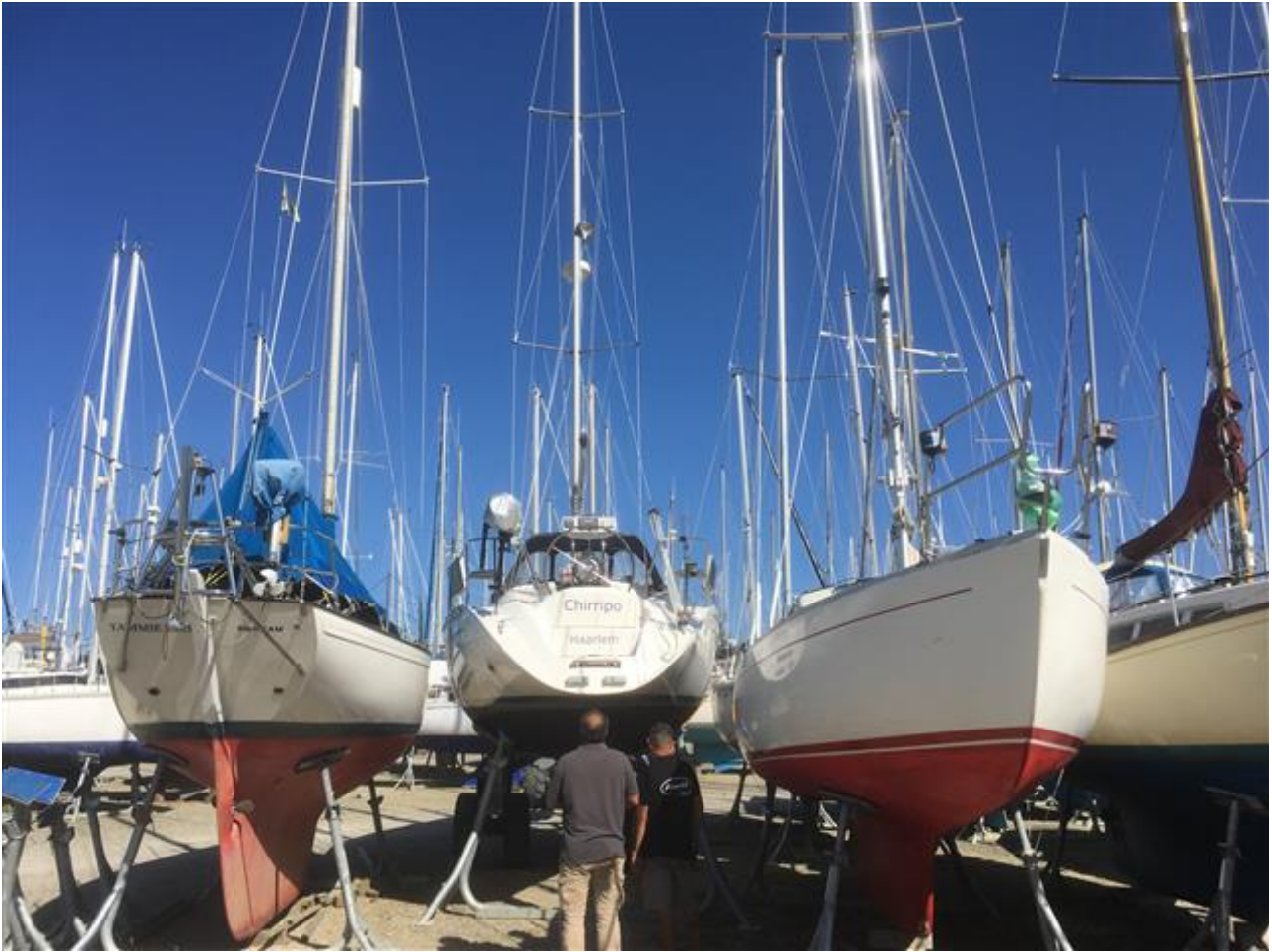
Het is druk op de kant