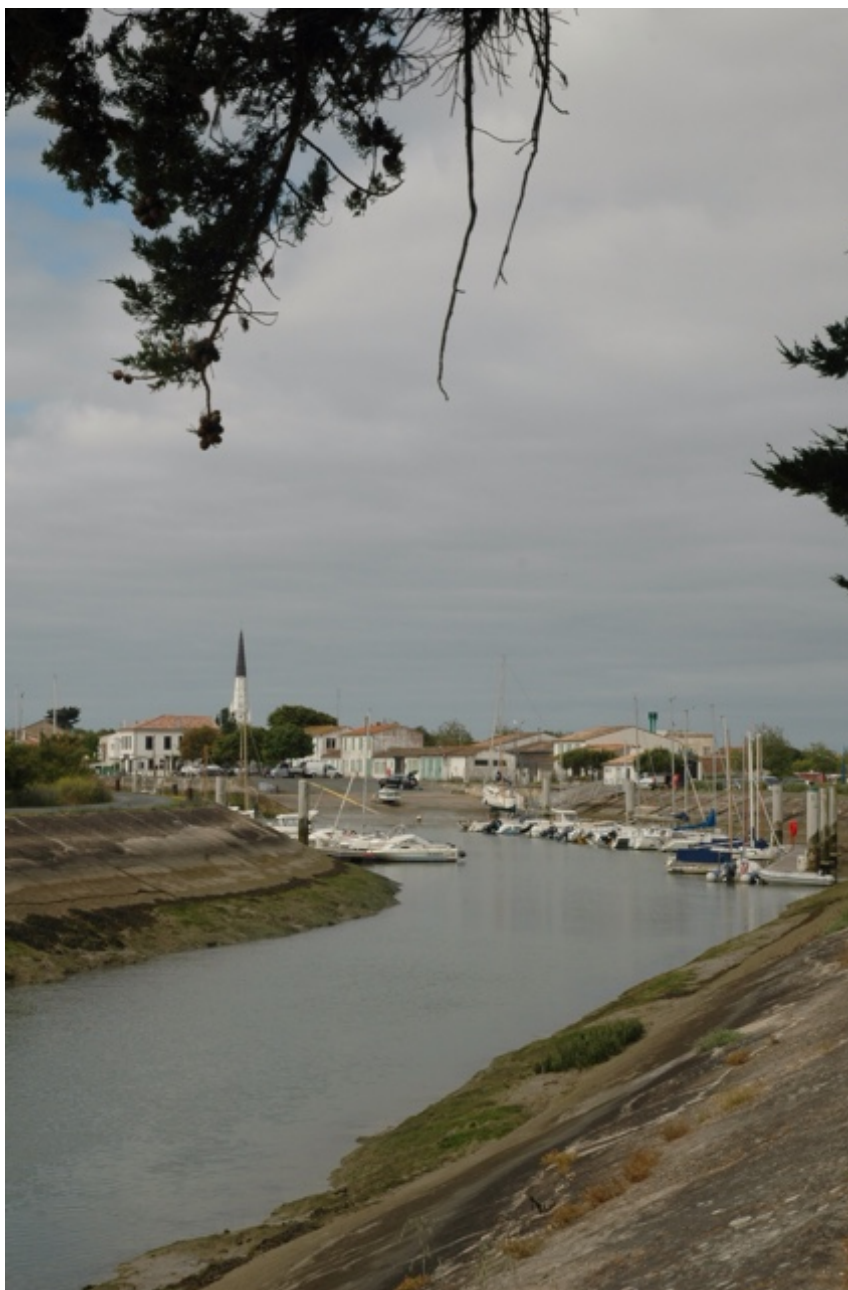
Ars en Ré

maar het kantoor geheel uitgestorven. Ik ben de trap naar boven opgelopen en trof daar een geblondeerde vijftigjarige dame aan met een verlopen uiterlijk, een alcoholstem en een sigaret in haar mondhoek. Ze kon onze buiskap maken voor vijftig euro maar dan moest ik hem wel om half vijf precies komen halen. Zo gezegd zo gedaan. Om drie voor half vijf was ik terug. Ze had de reparatie perfect uitgevoerd. Op mijn vraag over een nieuwe hoes rond het stuurwiel liep ze mee naar de aangrenzende winkel om het aan haar copine daar te vragen en vervolgens naar een andere neringdoende daar weer naast. Ze liet me achter. Toen ik het adres had gekregen van een zaak in het centrum van la Rochelle liep ik terug naar mijn vriendin. Ik schrok. Mijn fiets was verdwenen samen met de gerepareerde buiskap. Hij zou toch niet gestolen zijn? Dat viel mee, ze had hem binnen gezet.