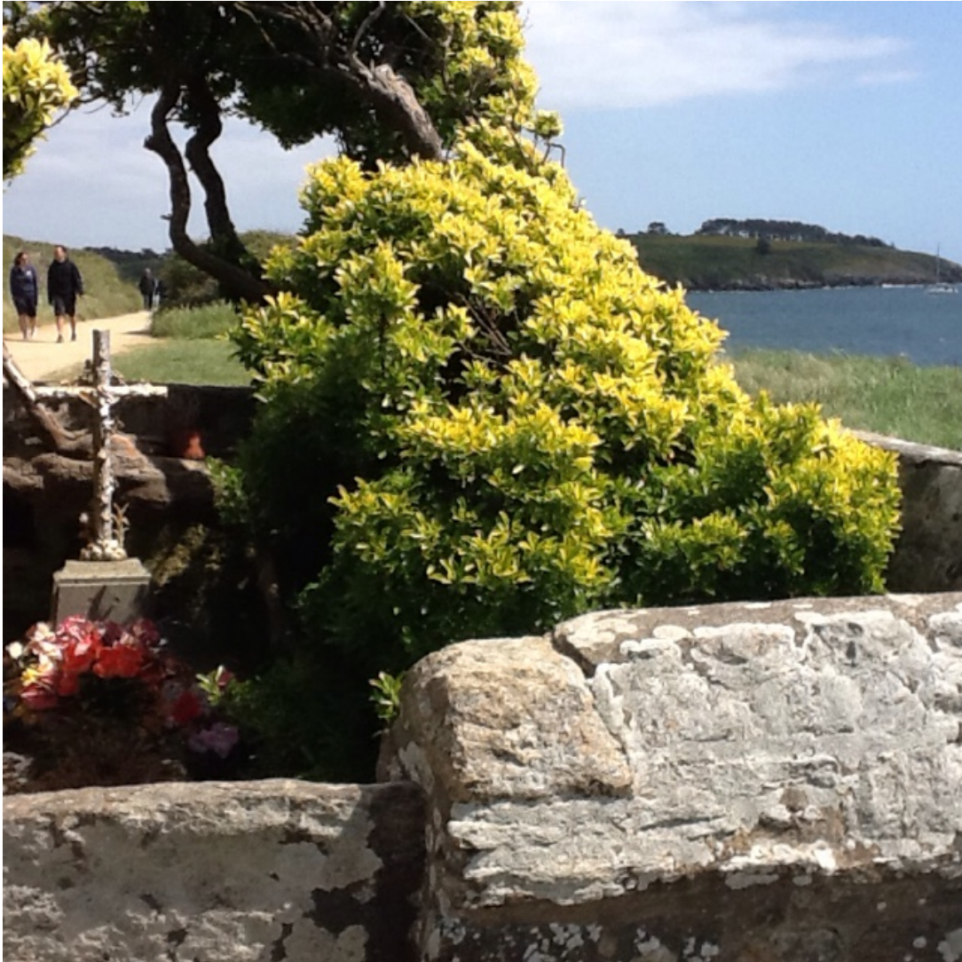
Het graf van le Petit Mousse