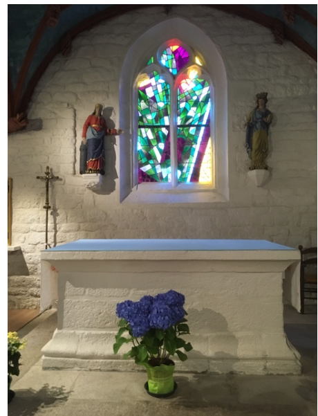
Sainte-Marine, het haventje en het kerkje