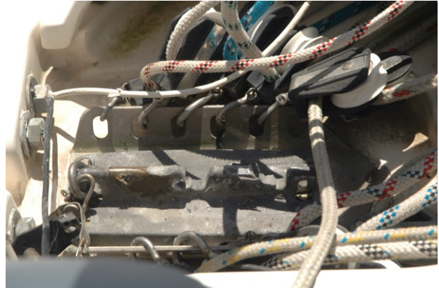
Een bever en een kapotte mastvoet