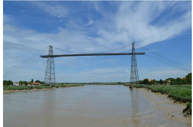
De overdekte lijnbaan (corderie royale) en de transbordeur in volle glorie