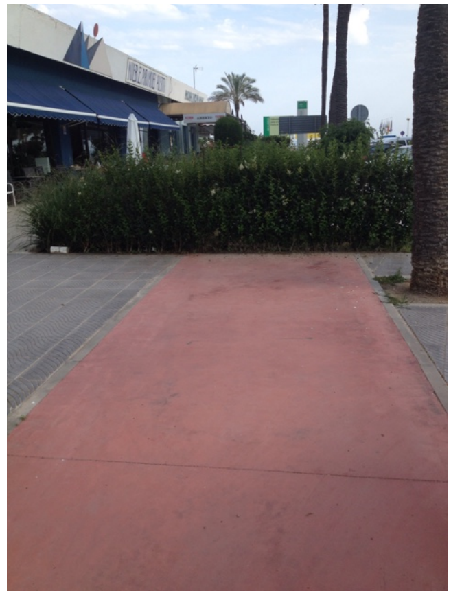
Fietspad in Caleta de Velez