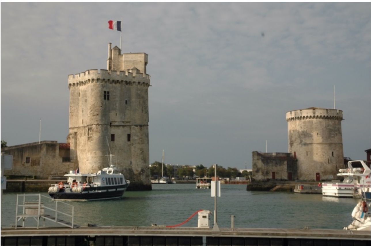
La Rochelle, gezien vanaf de boot in de vieux port

Men is bezig het gebied rond de oude haven op te stoten in de vaart der volkeren. Maar dan wel met respect voor de historie. De oude verroeste ringen voor de meertouwen, die in de loop van de vele jaren hun spoor hebben uitgesleten in de blokken natuursteen, mogen gelukkig blijven liggen. Les Minimes, de nieuwe jachthaven buiten de stadsmuren daarentegen is een sfeerloze botenparkeerplaats. Er is plaats voor duizenden jachten, verdeeld over meer dan zestig lange steigers. Het geheel beslaat een aantal vierkante kilometers. Aan de ander kant heeft het ook zijn voordelen. Wat je ook op botengebied wilt regelen of laten repareren, het kan. Omdat we een aantal onderdelen nodig hadden zijn we er de tweede dag toch maar heen vertrokken, ondanks mijn aversie tegen de massaliteit en het gebrek aan ambiance. Maar die komen we wel weer tegen in St. Martin de Ré, onze volgende bestemming.