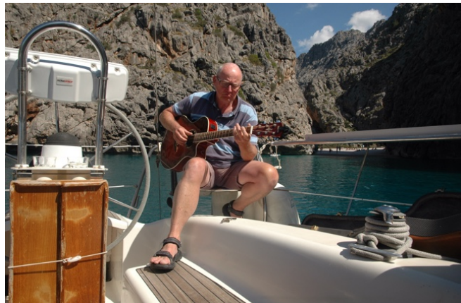
Alweer voor anker, nu in Cala de Calobra