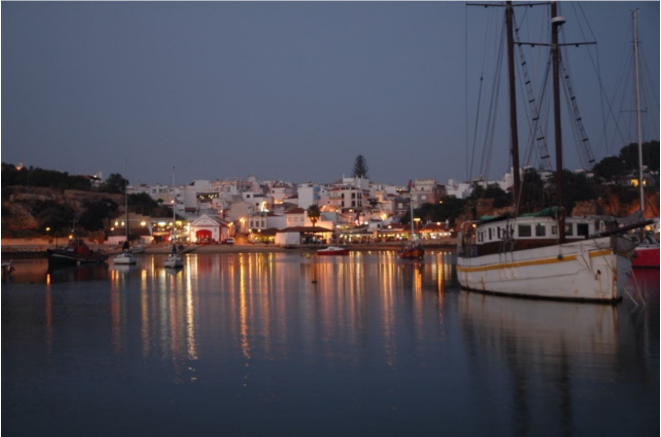
Driemaal Ferragudo en éénmaal Alvor by night