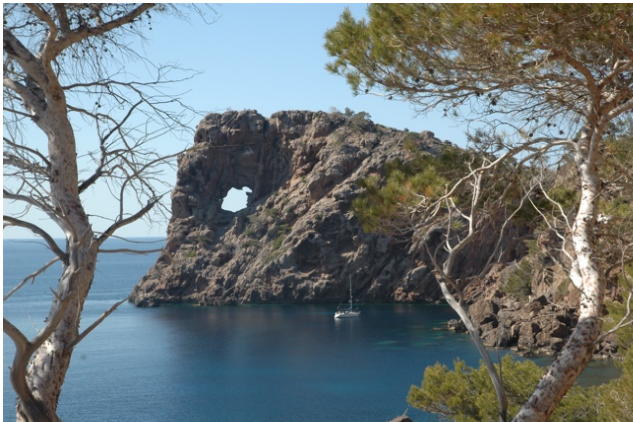
Ankeren bij Santa Foradada