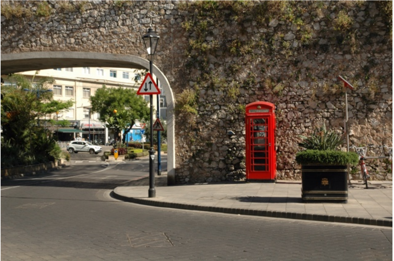
Typically British, hoewel, op één detail na.....

willen zijn dat als de sodemieter te vervangen door een Brits of Gibralteranees exemplaar. Ik was dat toch al van plan geweest, ik had het Britse vlaggetje in mijn zak, maar eigenlijk vond ik het klaarmaken voor het aanleggen belangrijker dan een lapje stof. Bij het aanlopen hadden we al gezien dat vanwege de aanslagen in Manchester en Londen op verschillende plaatsen de vlag halfstok hing. Ik heb de havenmeester nog gevraagd (zonder ironie!) of het een idee zou zijn als ik uit beleefdheid ons vriendschapsvlaggetje halfmast zou hangen maar daar had hij nog nooit van gehoord.