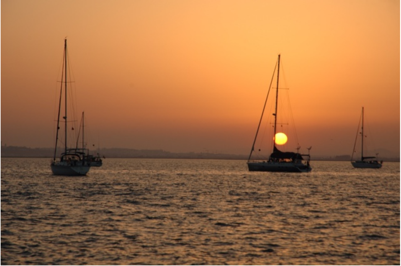
Zonsondergang bij Culatra