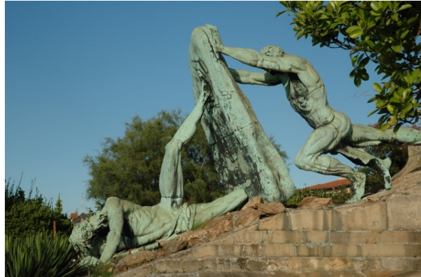
De transbordeur en de overwinning van Bilbao op Neptunus