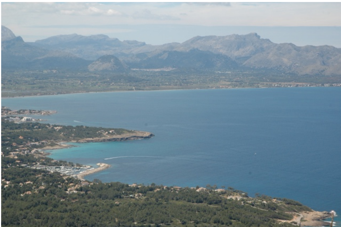
De baai met links onderin de haven van Bonaire

Ondanks dit alles is het hier prachtig om te wandelen, de uitzichten boven vanaf de berg zijn adembenemend. De beide baaien van Alcúdia en Pollensa, blinken in het zonlicht en wazig aan de noordoostelijke horizon kun je Menorca zien liggen. We willen er morgen naar gaan oversteken. De verwachting is dat de wind dan gunstig is.