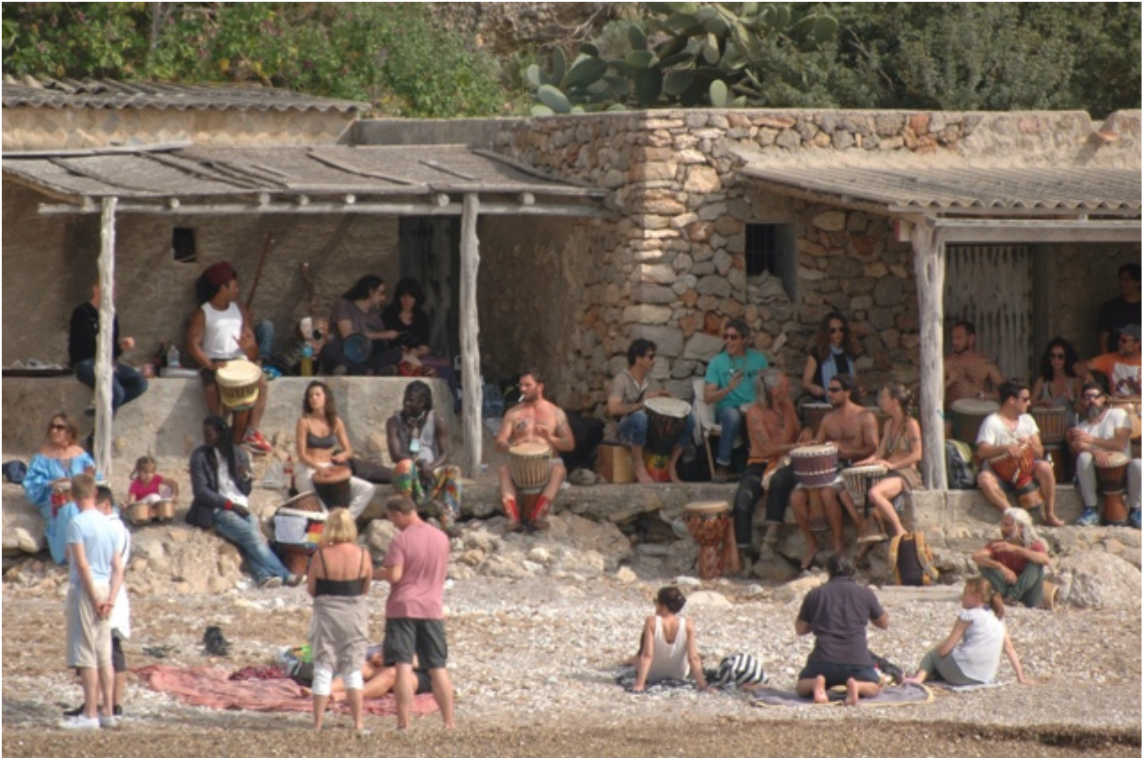
De trommelaars in Binirrás

Op Ibiza lopen verschillende gemarkeerde rondwandelingen. Een ervan begint vlak bij de Cala. Dat konden we niet laten liggen: een wandeling van 14 kilometer langs de kust en door de heuvels. De combinatie van wandelen en varen is precies waar we naar op zoek zijn. Bij de volgende aanlegplaatsen moeten we kijken of er nog meer mooie voettochten te maken zijn.