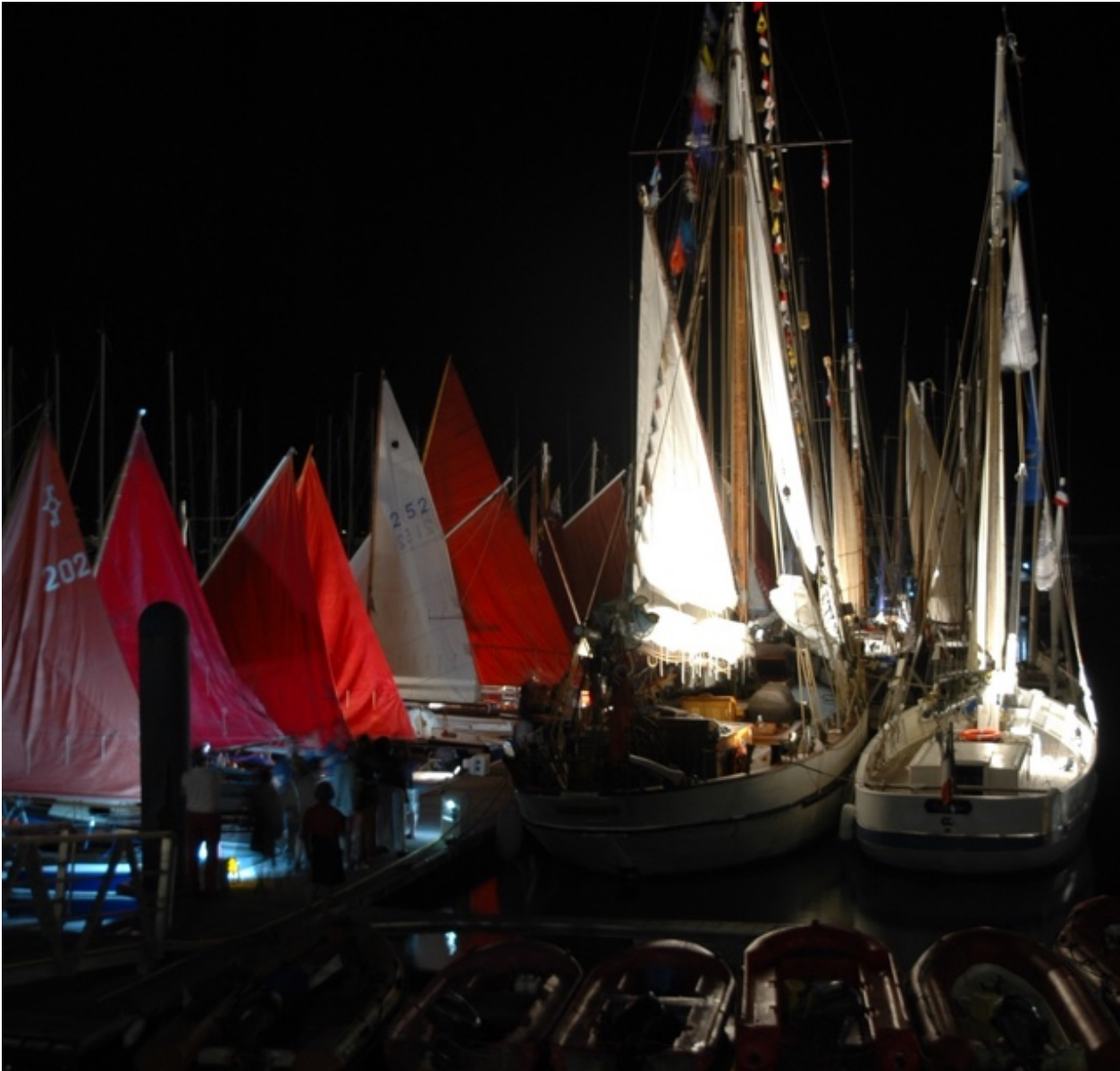
Nachtelijke vlootshow in St. Denis

En dat allemaal in mijn Frans. Ik ben bang dat dit niet gaat lukken. We zijn doorgevaren naar St. Denis d'Oléron.