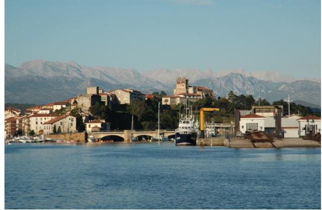
San Vicente de la Barquera