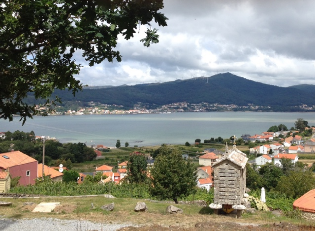
De Ría de Muros met op de voorgrond een van de vele horreos