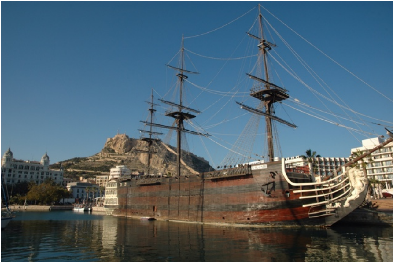
De Santísima Trinidad met op de achtergrond het Castillo Santa Barbara