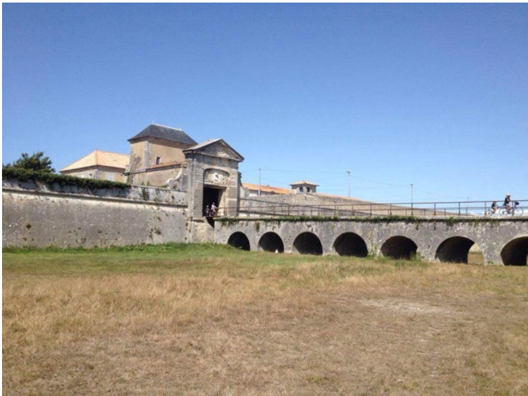
De stadsmuur, de poort, het fietspad en de gevangenis

We wilden naar Ars en Ré gaan. Britten vinden de naam nogal lachwekkend, je spreekt de s namelijk gewoon uit. Ars is een lief plaatsje, een stukje noordelijker op het eiland. Het is er veel rustiger dan in St. Martin. De invaart valt droog dus je kunt er alleen bij hoog water aanlopen. Op dit moment is de coëfficiënt, de indicator voor het getijdenverschil, erg laag. Dat wil zeggen dat het water weinig zakt, maar ook niet veel stijgt. Wij kunnen er dan hoogstens tussen een half uur voor en na hoogwater naar binnen. Dat riskeren we maar niet. Dan maar in St. Martin wachten op een gunstige wind om verder naar het noorden te zeilen.