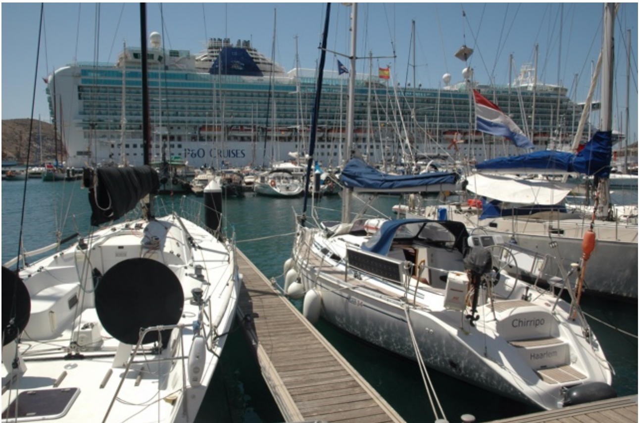
Onderscheid moet er zijn

Cartagena is vergeven van de cruise-toeristen. Het zijn meestal echtparen van gevorderde leeftijd. Ze bewegen zich in kuddes voort, een gele sticker met het nummer van hun roedel op de borst geplakt. Dat nummer correspondeert met het bordje dat door een voorop lopende man omhoog gehouden wordt. Hij leidt zijn klasje langs de bezienswaardigheden van de stad. Daarbij geeft hij versterkte toelichting op het gebodene. Hij heeft namelijk een keelmicrofoon die een speakertje aan zijn riem aanstuurt. Ook voor de mensen aan de andere kant van het plein is hij goed te verstaan. Zijn volgelingen kijken er geïnteresseerd bij. Je wilt tenslotte waar voor je uitgegeven kapitaal.