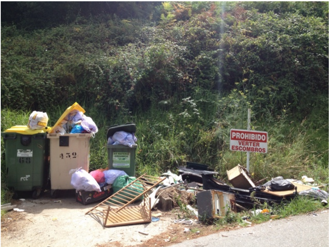
Ook Spanjaarden houden zich altijd aan de regels (tekst op het bord: "verboden vuil te storten")

We zijn van plan te gaan verhuizen naar de Ría de Muros. Eerst naar Portosin omdat daar onze gasflessen kunnen worden gevuld met propaan, daarna naar Muros zelf en dan hopen we in de loop van volgende week een gunstige wind te hebben om Finisterre om te gaan. Ik hoop dat we dan ook weer de hoeveelheden dolfijnen zullen tegenkomen die we de afgelopen tijd hebben gezien. Wat zijn dat toch een prachtige beesten.