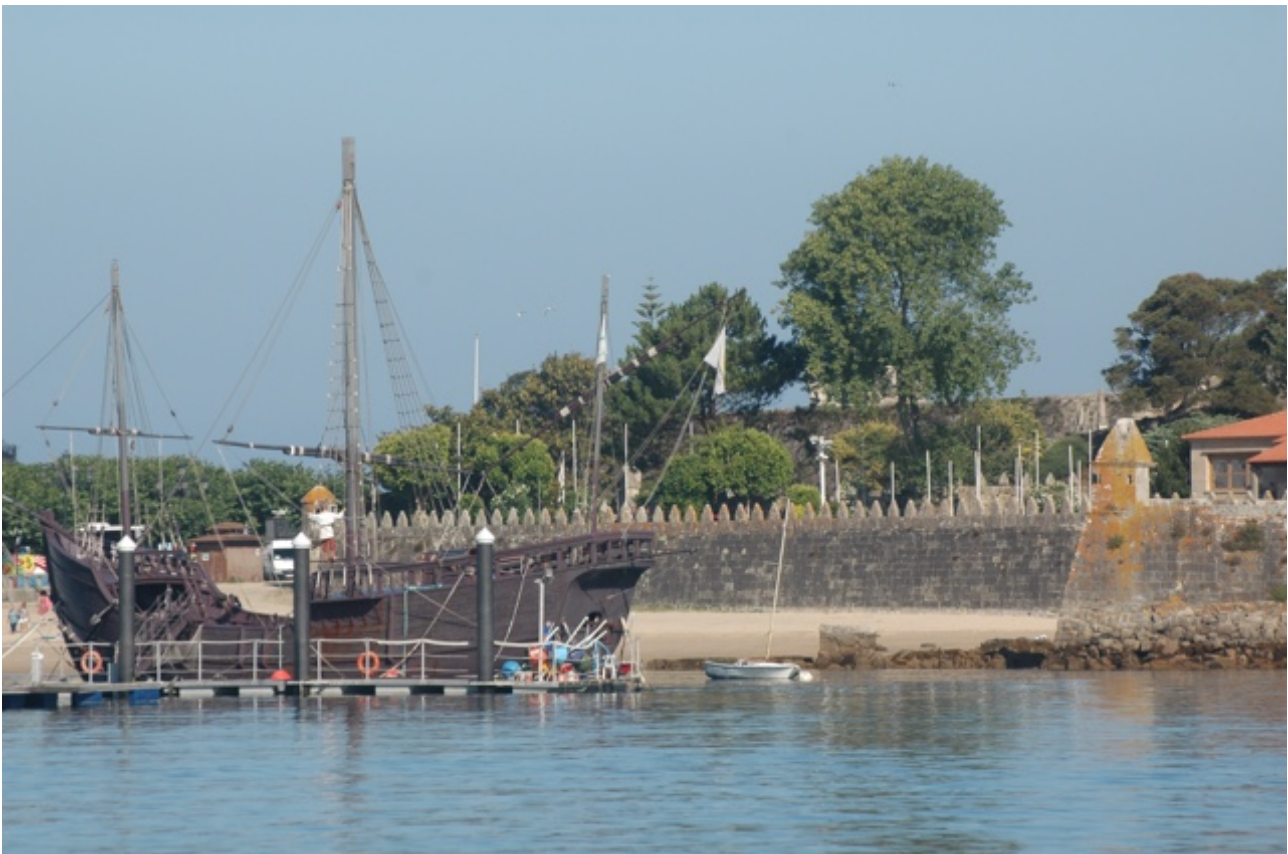
De replica van de Pinta

Na Viana do Castelo veranderde het landschap. De vlakke kust met eindeloze zandstranden maakte plaats voor rotsen en bergen aan de horizon. Dat zet zich verder voort in de Rías. Dit is een gebied waar we vorig jaar en twee jaar geleden al uitgebreid hebben rondgekeken. Nu dit doel is bereikt kunnen we rustig aan verder zeilen. De noordenwind zal naar verwachting niet meer zo dominant zijn. Voordat we op 3 oktober de trein naar Nederland nemen willen we eerst nog een tijdje hier rondhangen en dan via de Spaanse noordkust naar Bretagne varen, een tocht van zo'n 800 mijl. Maar goed, daar hebben we dik twee maanden voor uitgetrokken. Het voordeel van de havens in Spanje en Frankrijk is dat ze bijna allemaal "gratis" zijn. Met het passeport escale wat we hebben gekocht kunnen we elke keer twee nachten liggen. Steeds meer Spaanse havens treden toe tot de "club". Dat is voordelig voor hen. De aangesloten havens liggen duidelijk voller dan de niet-leden. Vooral met Fransen uiteraard, je kunt alleen een passeport kopen als je een ligplaats in de Morbihan hebt.