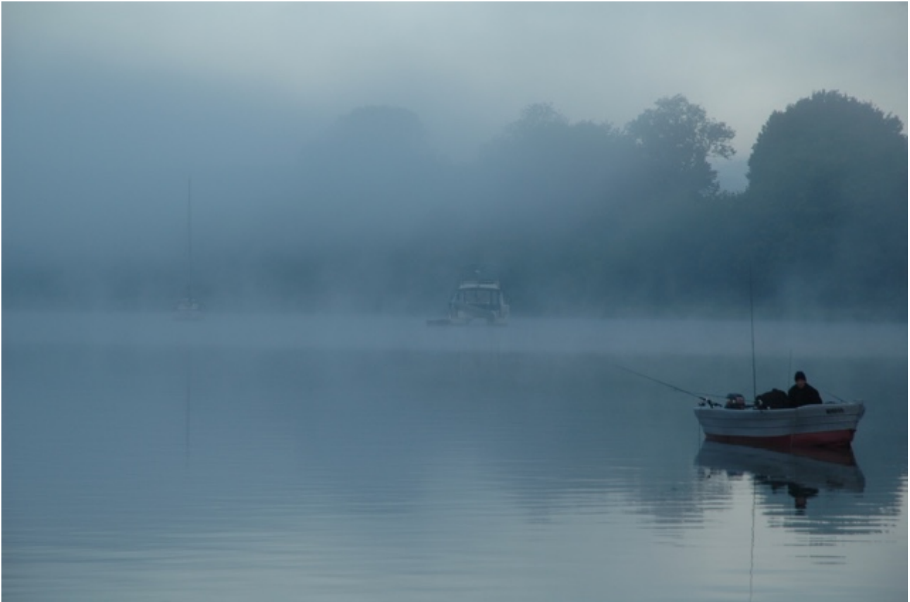
Ochtendmist op de Vilaine