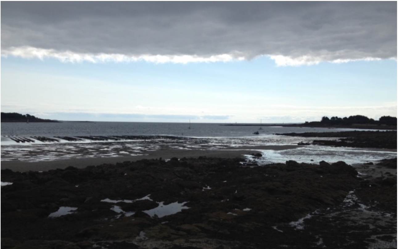
Laag water, oesterbedden en een frontje (la Trinité)

naam bewaart. Toen ik vroeg wat daarvan de reden zou kunnen zijn werd ik aangekeken of ik van een andere planeet kwam: voor controle door de belasting natuurlijk! Ik had het kunnen weten. Het was Volendam.