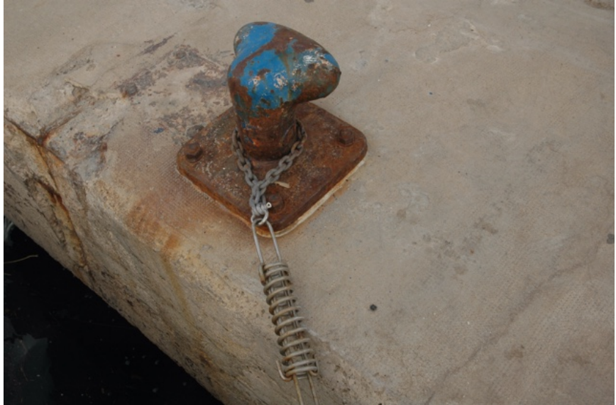
Het wrijfhout en de veer