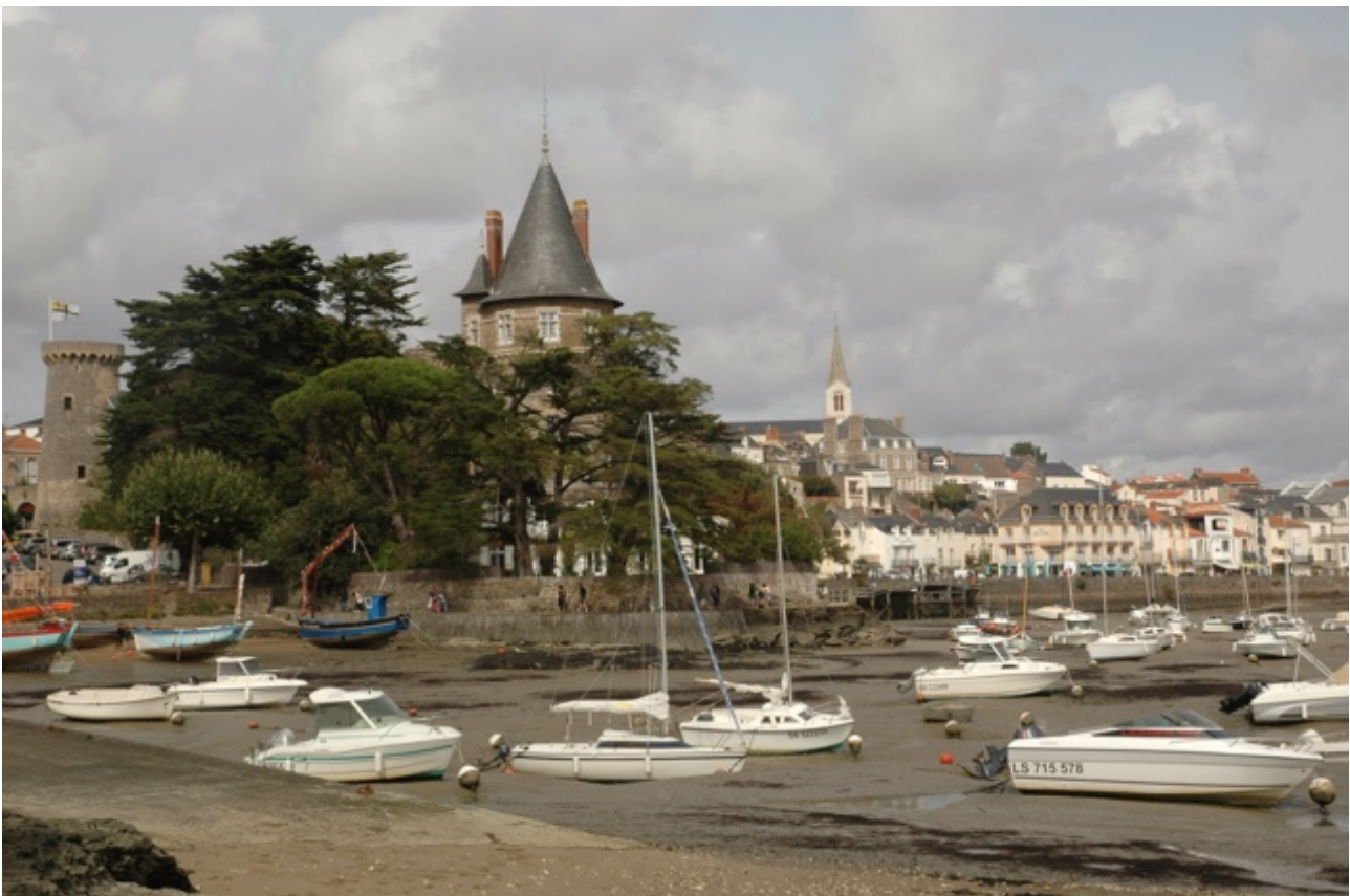
Pornic met het kasteel van Blauwbaard