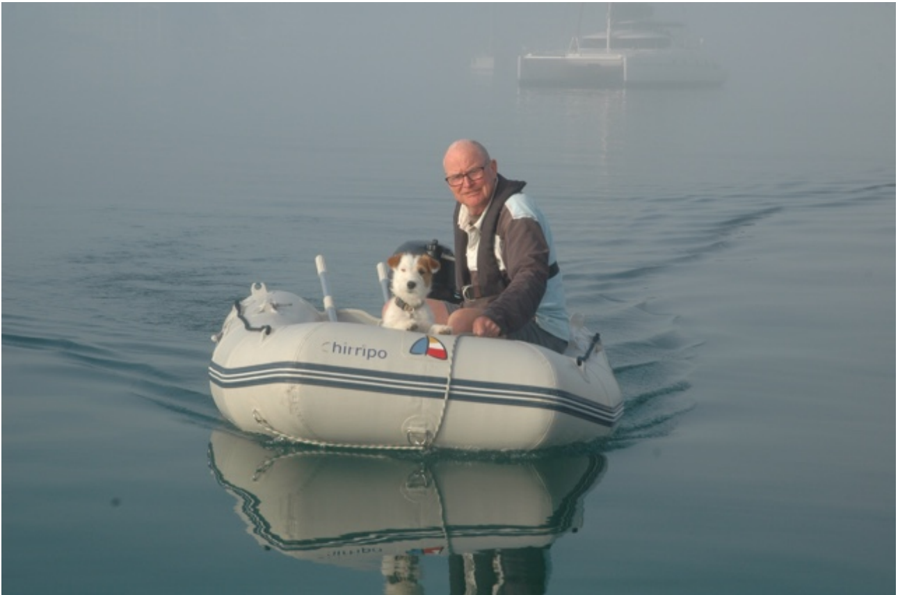
Opdoemend uit de mist