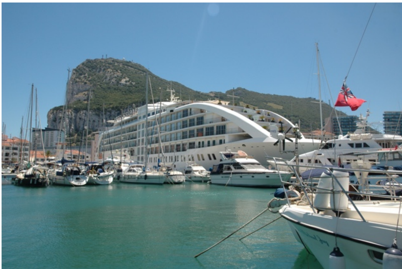
Het uitzicht vanaf ons achterbalkon, het schip is een hotel annex casino

wordt bewaakt door twee oude kanonnen, met dichtgegoten lopen, die na sluitingstijd een jas aan krijgen en aan de andere kant ligt the Convent, de officiële ambtswoning van de Gouverneur van Gibraltar met een soldaat ervoor. Hij staat doodstil, maar iedere paar minuten presenteert hij het geweer met bajonet, stampet met zijn te grote glimmend gepoetste schoenen, marcheert tien meter, keert weer terug, schouderet het geweer en speelt weer voor levend standbeeld. De eerste keer dat we het zagen was het een jongen van een jaar of twintig, we dachten een stagiaire, maar de volgende dag was hij afgelost door iemand die zijn vader kon zijn. Hij stond dus blijkbaar aan het begin van zijn carrière. 's- Avonds gaan de deuren niet dicht maar komt er een spijlenhek voor de marmeren ontvangsthal. Achter dat hek zet men dan een schildersezal met daarop een statiefoto van Queen Elizabeth. Tot de volgende morgen mag zij de zaak bewaken. Omdat we vroeg willen vertrekken op woensdag en de haven gesloten is tot half negen, zijn we in de marina naast het vliegveld gaan liggen. Daar kun je wel uit. Onderweg hebben we nog even getankt. Je snapt waarom boten wachten met tanken tot ze in Gibraltar zijn, de prijs van een liter diesel is hier de helft van die in Spanje: 58 cent.