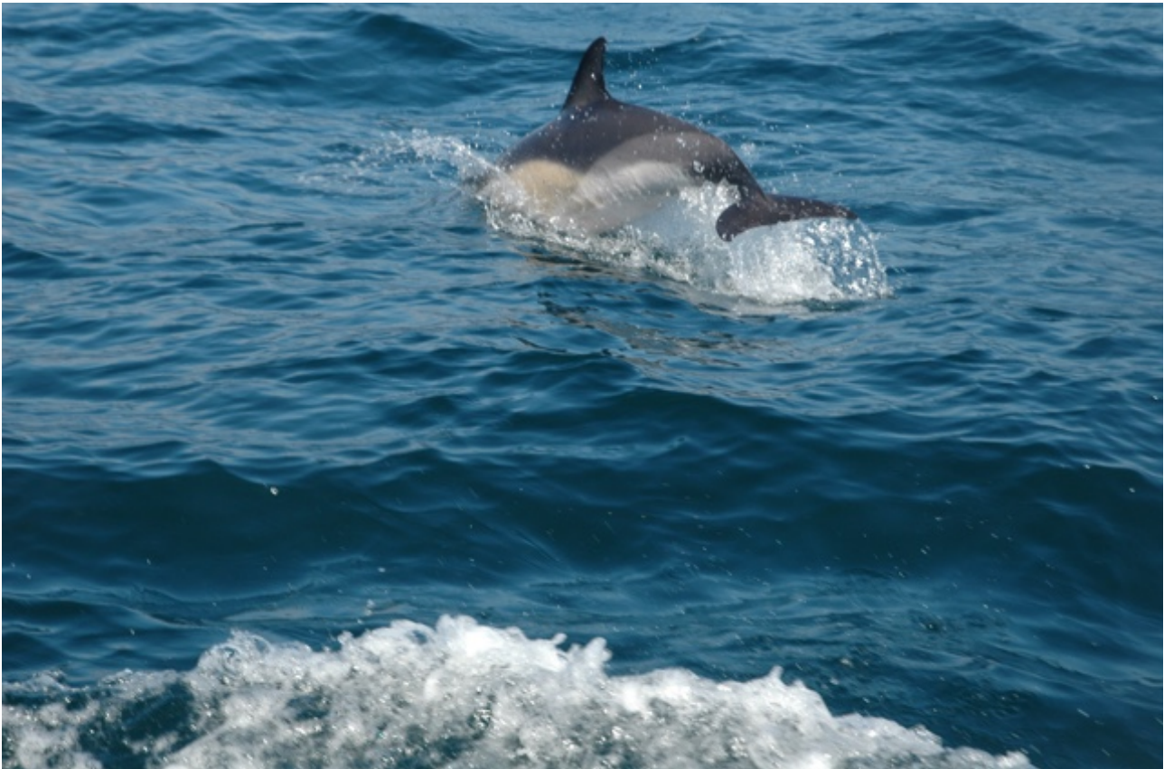
Shit, weer net te laat!