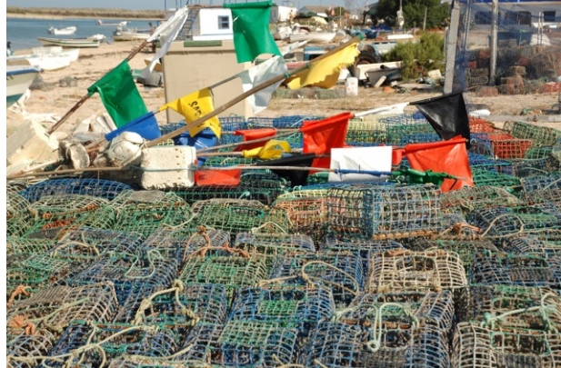
In het water en op de kant