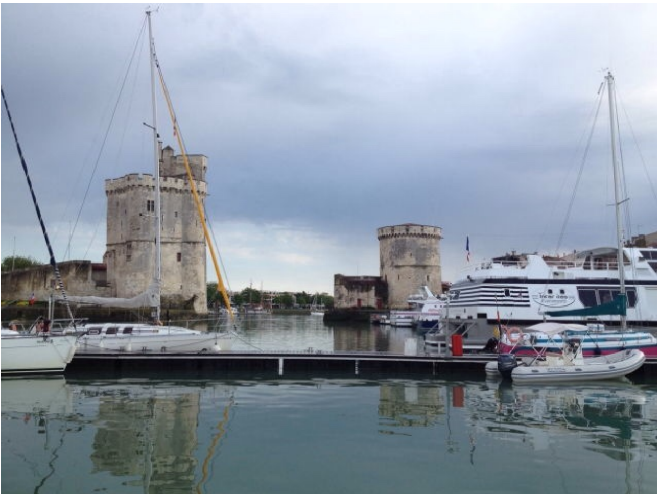
Zo lig je in de oude haven van La Rochelle

Nu liggen we dus in die enorme botenparkeerplaats (6.000 plaatsen, verdeeld over 65 steigers, 7 toiletgebouwen en een oppervlakte van ongeveer 80 ha.) om vandaar uit naar Gijon te vertrekken. Waarschijnlijk is dit dus onze laatste nacht in Frankrijk.