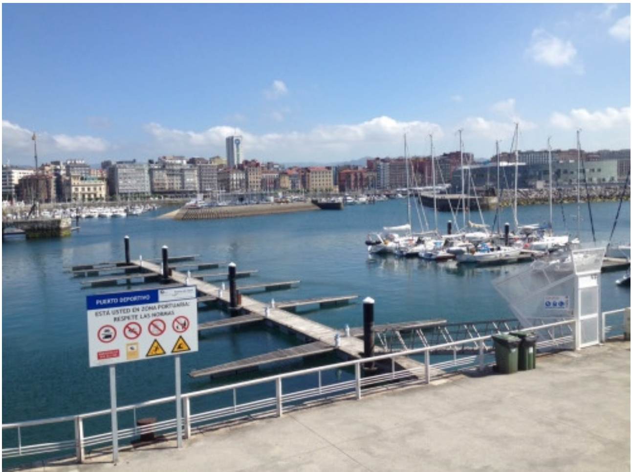
De haven van Gijon met Chirripo aan de steiger

Eén ding hebben we gemist de afgelopen dagen, de walvissen. Maar daarmee gaat het net als de elanden in Zweden: je weet dat ze er zijn maar wij zien ze niet.