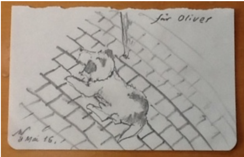
De tekening van Ollie

Het wordt tijd voor een nieuwe fase in de tocht.