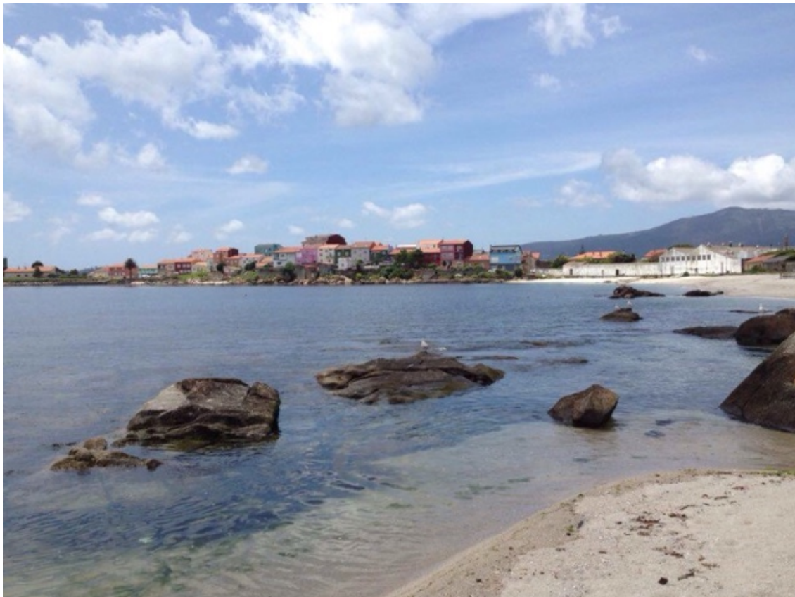
Boiro, Cabo de Cruz in de Ria de Arousa

De komende dagen gaat het weer eindelijk verbeteren. Halverwege volgende week worden temperaturen verwacht van rond de 25 graden. Dan kunnen we eindelijk weer eens gaan zeilen in een korte broek en t-shirt. Het mooie van de wind is dat hij volgens verwachting steeds in de loop van de dag zal gaan toenemen en vooral uit noordelijke richting zal gaan waaien. Dat is gebruikelijk langs de Portugese kust. Voor ons gunstig, niet voor degenen die naar het noorden gaan. We zien uit naar varen met mooi weer en een lekker windje. En naar de Portugese kust. Hier zijn we eerder geweest, het avontuur van nieuwe havens en nieuwe vergezichten lokt.