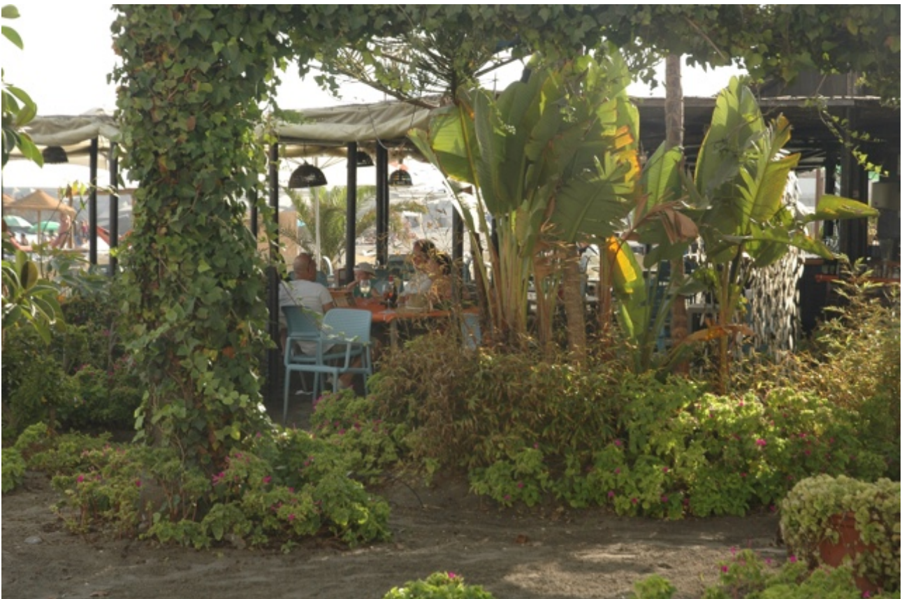
Caleta de Vélez

Torremolinos hebben we alleen vanaf zee zien liggen. Het heeft geen haven. In Málaga zijn we volgens de pilot niet welkom. Dus zijn we doorgevaren naar Caleta de Vélez. Dat is een lief vissershaventje met een slaperig stadje vol expats met een strand van steentjes en zwart zand. Bij het tentje waar we hebben zitten eten speelde een band van Engelse zestigers. Ze hadden hun groupies bij zich, waardoor het geheel helemaal een zeventiger jaren sfeer uitademde. Dat werd nog versterkt door de lampen in de strandtent met gevlochten rieten lampenkappen, het zand onder de tafeltjes en stoelen en de zwoele avondlucht met van de bliksem oplichtende wolken boven zee. Ik miste de joint. Het was zo relaxt dat we besloten hebben een dag over te blijven. Ook al omdat er geen zuchtje wind stond.