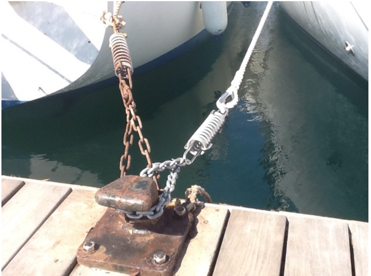
De nieuwe schokbreker (die roestige is natuurlijk van de buren)