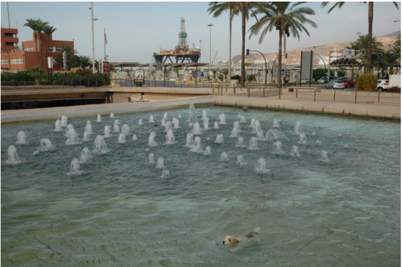
De Cable Inglés, het Alcazaba en een fontein