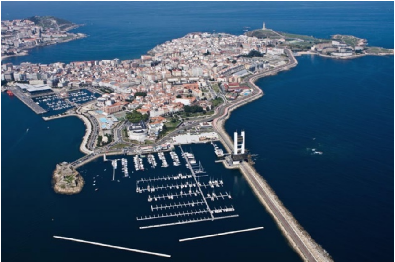
A Coruña met "onze" jachthaven op de voorgrond

vertrokken naar Ribadeo. Omdat het zondag was en de bakker pas om half tien open ging konden we niet vroeg vertrekken. In tegenstelling tot wat er verwacht werd stond er een behoorlijk windje en werd het een mooie zeiltocht. Alleen was Ribadeo met zijn 62 mijl afstand nu net iets te ver. Dus besloten we de nacht door te varen. Viveiro, de volgende plaats met een behoorlijke haven, was bij doorvaren net weer iets te dichtbij. We zouden daar nog steeds in het donker aankomen. Ook al omdat we de kust hier kennen van vorig jaar werd het doel. A Coruña. Intussen werd Ollie steeds onrustiger, ging scharrelen en piepen. Hij was al meer dan twaalf uur niet "uit" geweest. Ik heb zelfs nog overwogen hem het gebruik van de hondendoos te demonstreren. Uiteindelijk heeft hij, onder luid gejuich tegen twaalf uur 's-avonds zijn schroom overwonnen. Hij heeft een paar beloningssnoepjes gekregen en is in zijn mand gaan liggen slapen, gevolgd door Hanneke die ook een paar uur is gaan pitten. Het blijft afwachten hoe het met de grote poep gaat. Dat zal wel Coruña worden.