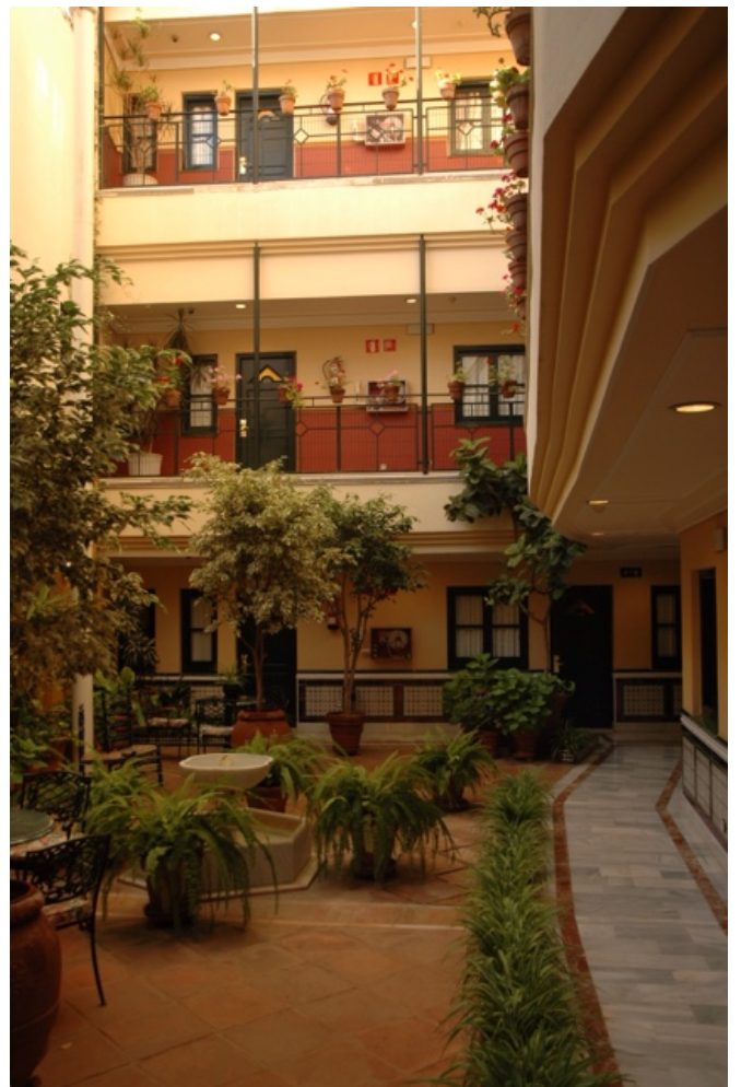
Sevilla: Torre del Oro, een straatje met verfrissende waterdamp en de binnenplaats van ons hotel