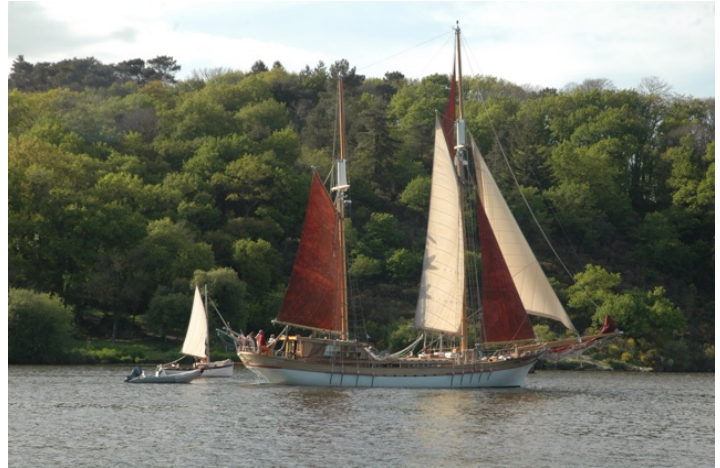
het grootste klassieke feestschip