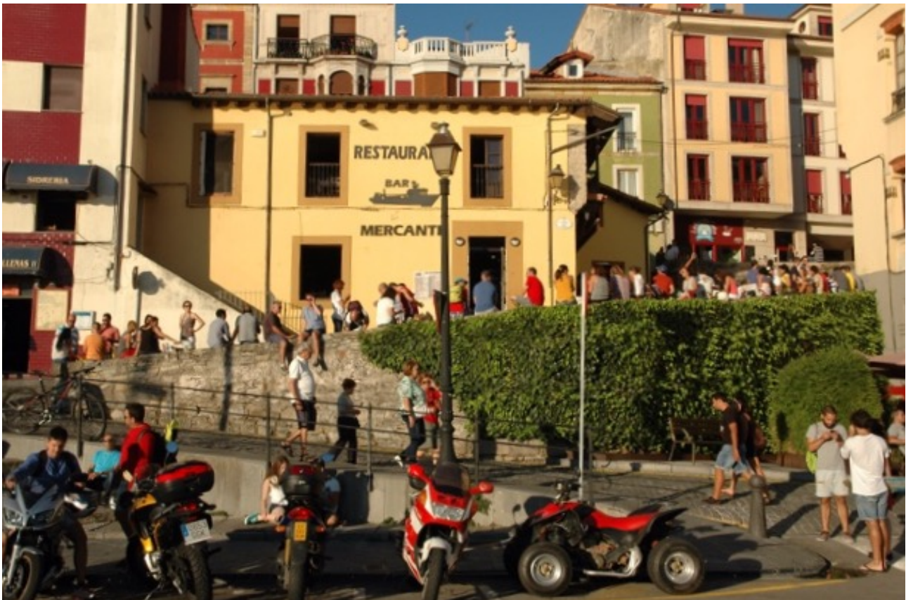
Het cafeetje bij de haven (foto van vorig jaar)

Het levenstempo van de Spanjaarden blijft me verbazen. 's-Morgens voor tien zijn de straten uitgestorven, ook op een doordeweekse dag. Pas tegen een uur of twaalf komt het leven op gang. Het is nu niet erg warm, een graadje of 19, dus in de avond is het niet echt druk op de terrasjes van de sidreria's in het oude wijkje boven de haven. Binnen daarentegen is het levendig. Wij aarzelen ook steeds of we aan dek kunnen eten of dat we toch maar beneden blijven. De komende weken hopen we toch wel op wat hogere temperaturen.